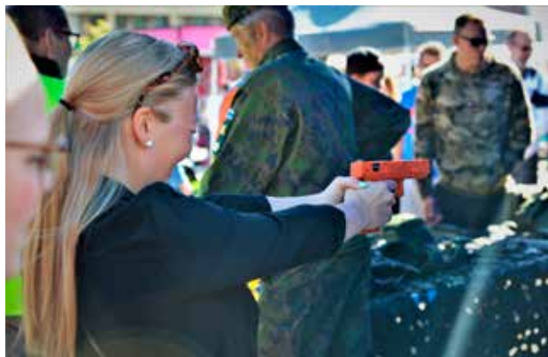
Ekoaseammunta oli suosittua viihdettä muuten niin asiapitoisella maanpuolustuspiirin osastolla. Ekoase on turvallinen tapa tutustua ampumaharrastukseen.