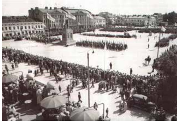
Kuva 1 Suomi on saanut muistomerkin vapaudelleen ja itsenäisyydelleen

http://vaasaennenjanyt.blogspot.com/2023/07/kierroksella-vapaudenpatsaan-ympari.html