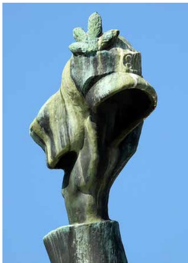
Kuva 9 Vapaussodassa käyttöön otettu suojeluskuntalaisten kuusenhavutunnus