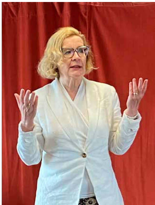
Juhlapuheen piti Naisten Valmiusliiton puheenjohtaja Paula Risikko.