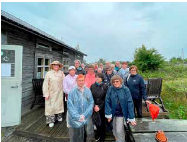
Cafe Tankar ja juhlaväki odottamassa saarikierrosta.

ovat aluetason yhteistyöelimiä. Vaasan alueneuvottelukuntaan kuuluu 10 järjestöä Etelä-Pohjanmaan, Keski-Pohjanmaan ja Pohjanmaan alueilta: Maanpuolustusnaisten Liitto ry:n Etelä-Pohjanmaan ja Pohjanmaan piirit, Vaasan Lottaperinneyhdistys ry, Lottatraditionsföreningen rf, Isonkyrön Lottaperinneyhdistys ry, ProAgraria Keski-Pohjanmaa ry/Keski-Pohjanmaan Maa- ja kotitalousnaiset, Etelä-Pohjanmaan kotitalousnaiset ry, Pohjanmaan Pelustusalanliitto ry:n naistyöryhmä, Etelä- ja Keski-Pohjanmaan reserviläispiiri ry, Keski- ja Etelä-Pohjanmaan Martat ry ja Maanpuolustuskiltojen liitto ry/Österbottens Försvarsgille – Pohjanmaan Maanpuolustuskilta rf.