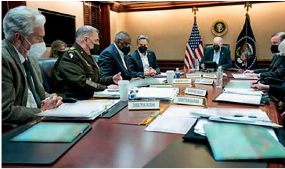
Yhdysvaltain presidentti Joe Biden kutsui kansallisen turvallisuuden neuvoston kokoukseen Venäjän sotaan valmistautumisen takia 20. helmikuuta 2022. Päivää aiemmin hän oli ilmoittanut medialle Venäjän tehneen päätöksen hyökkäämisen aloittamisesta.

Tämä esimerkki kertoo menneillä olevasta nykysuuntauksesta tiedusteluyhteisön ja tiedontarvitsijoiden välisissä suhteissa. Yhdysvallat korostaa tiedonjakamisen tärkeyttä sekä liittolaisilleen ja kumppa-