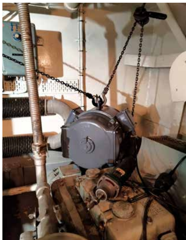
Kunnostettu muuttajakone menossa omalle paikalleen kone- huoneeseen.