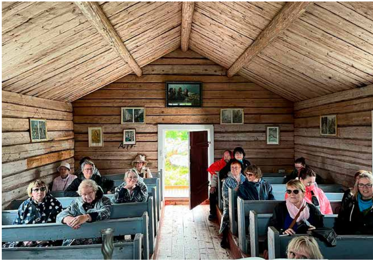
Saaren kirkko on nähnyt mielenkiintoisia aikoja.

naisille. Kursseilla on tilaisuus hankkia käytännön turvallisuustaitoja ja viettää viikonloppua satojen samanhenkisten naisten kanssa. Harjoitukset ovat hyvin suosittuja, ja kursseille on ollut enemmän hakijoita kuin on voitu ottaa mukaan. Vaasan alueneuvottelukunnan vastuulla on järjestää syksyllä 2024 PikkuNasta-harjoitus Lohtajan harjoitusalueella. Ilmoittautuminen tulee MPK:n kurssitarjontaan keväällä. Kannattaa olla valmiina heti kun ilmoittautuminen avautuu, jotta varmimmin pääsee haluamalleen kursseille.