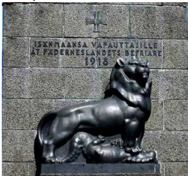
Kuva 4. Patsaan jalustan torille suuntautuvaa fasadia