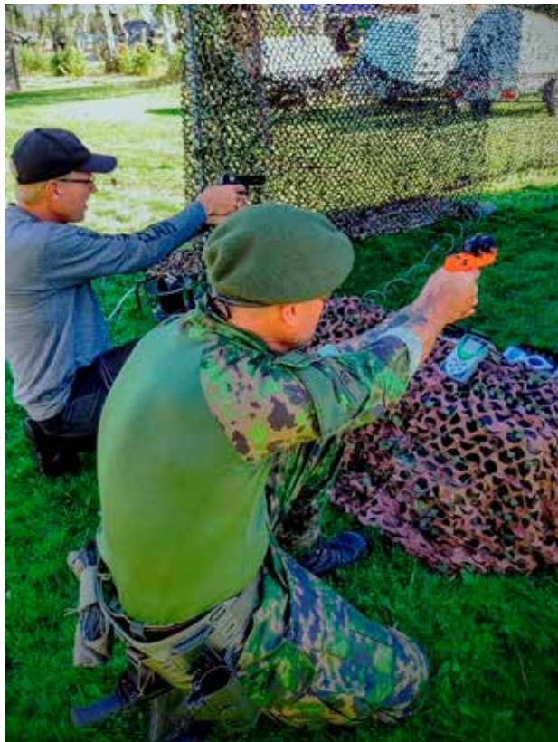
Ekoims-aseilla voi turvallisesti harjoitella erilaisia tapoja ampua. Polviasennosta ampuminen on aina tukevampaa ja tarkempaa kuin pystyammunta.

Seuraavat Ollikkala-messut järjestetään kahden vuoden päästä, 22.–23.8.2025.