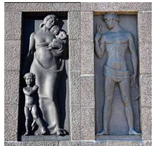
Kuva 7 Itäisen sivustan Työ- ja Tulevaisuus-allegoriat