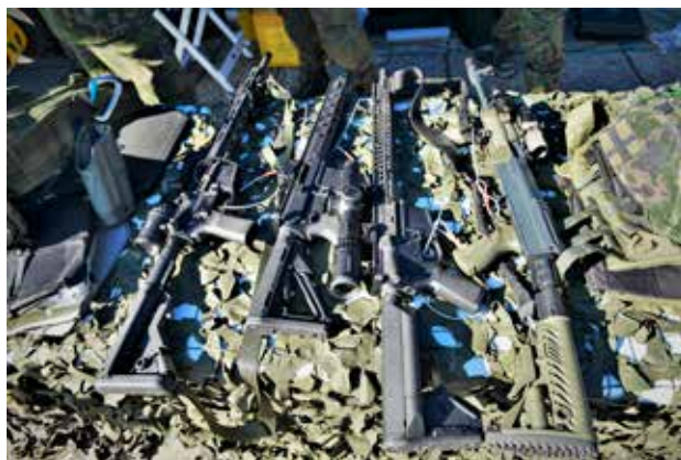
Itselataavia kertatulikiväärejä reserviläisammuntaan.