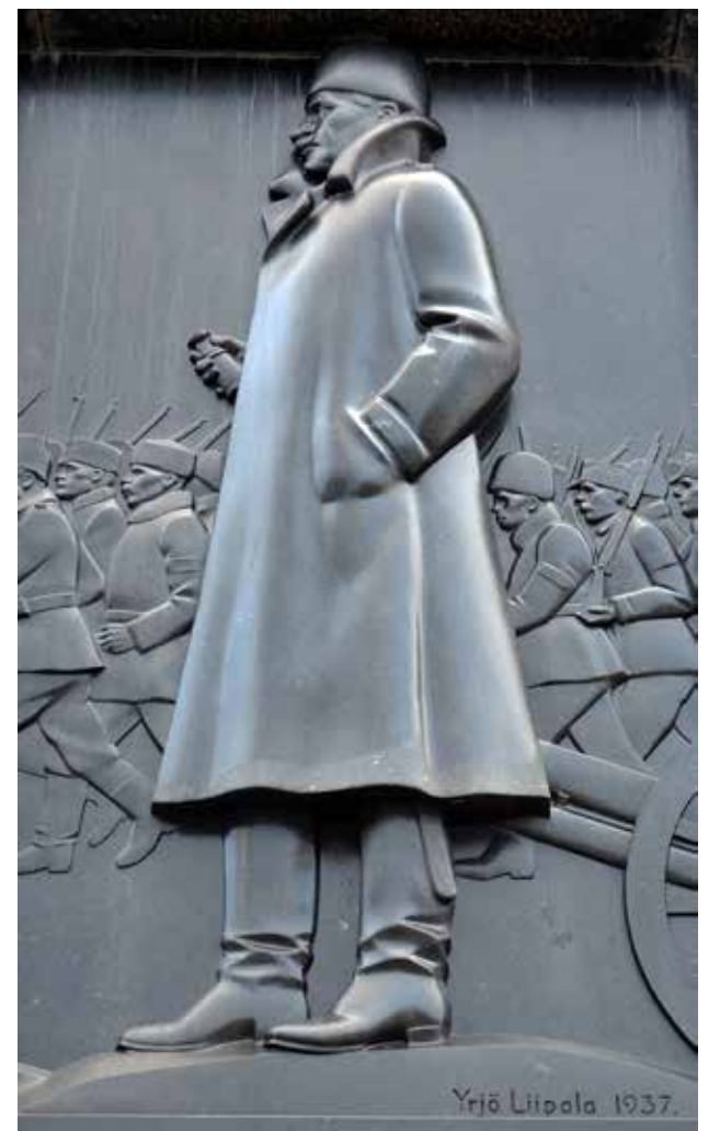
Kuva 6 Hovioikeudenpuoleisen sivustan Mannerheim-reliefi, Mannerheimin katse suuntautuu itään