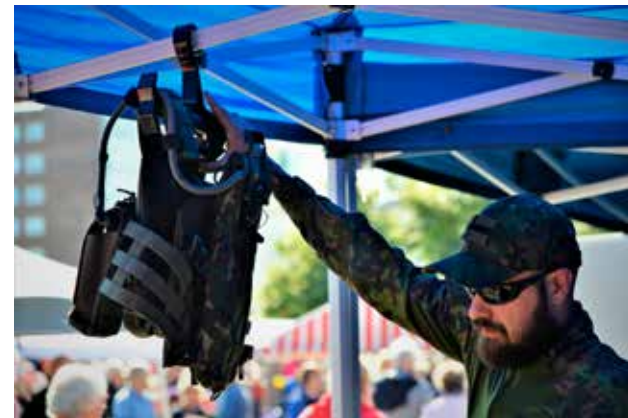
Omien mittojen ja vaatimusten mukaiset varusteet motivoivat aktiivisia reserviläisiä. Laadukkaat varusteet ovat hintavia, mutta julkisuudessa on keskusteltu mahdollisuudesta saada verotuksessa vähennystä niiden hankintahinnasta.