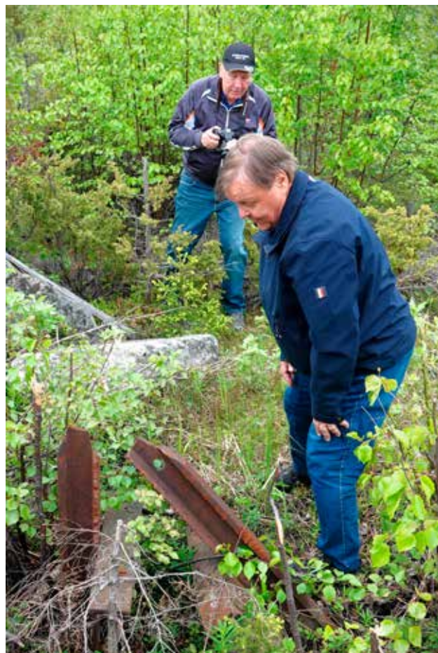
Kemin radan varrelta löytyi vielä sodanaikaisen vaihdekopin perustusten jäänteitä.