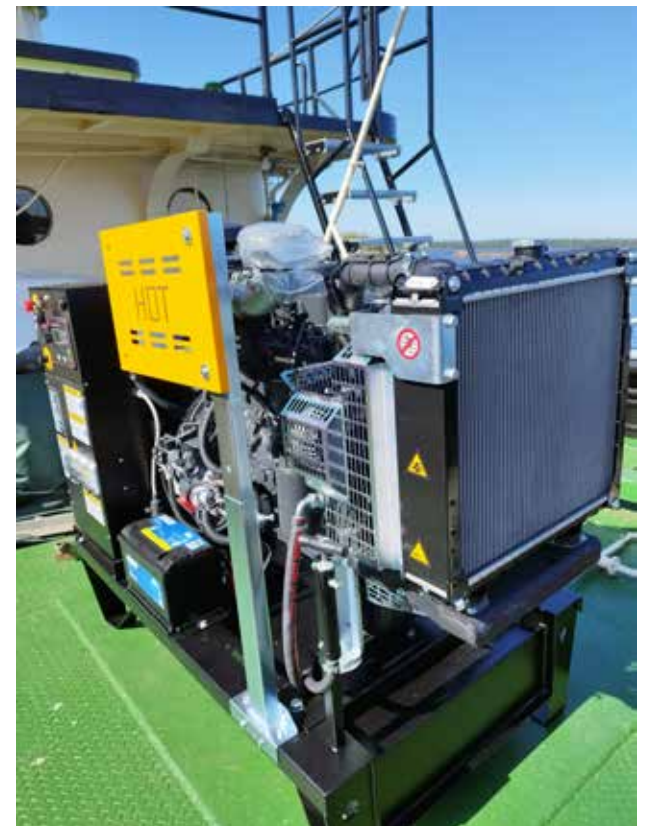
Alpon uusi Iveco generaattori kannella odottaa asennusta.