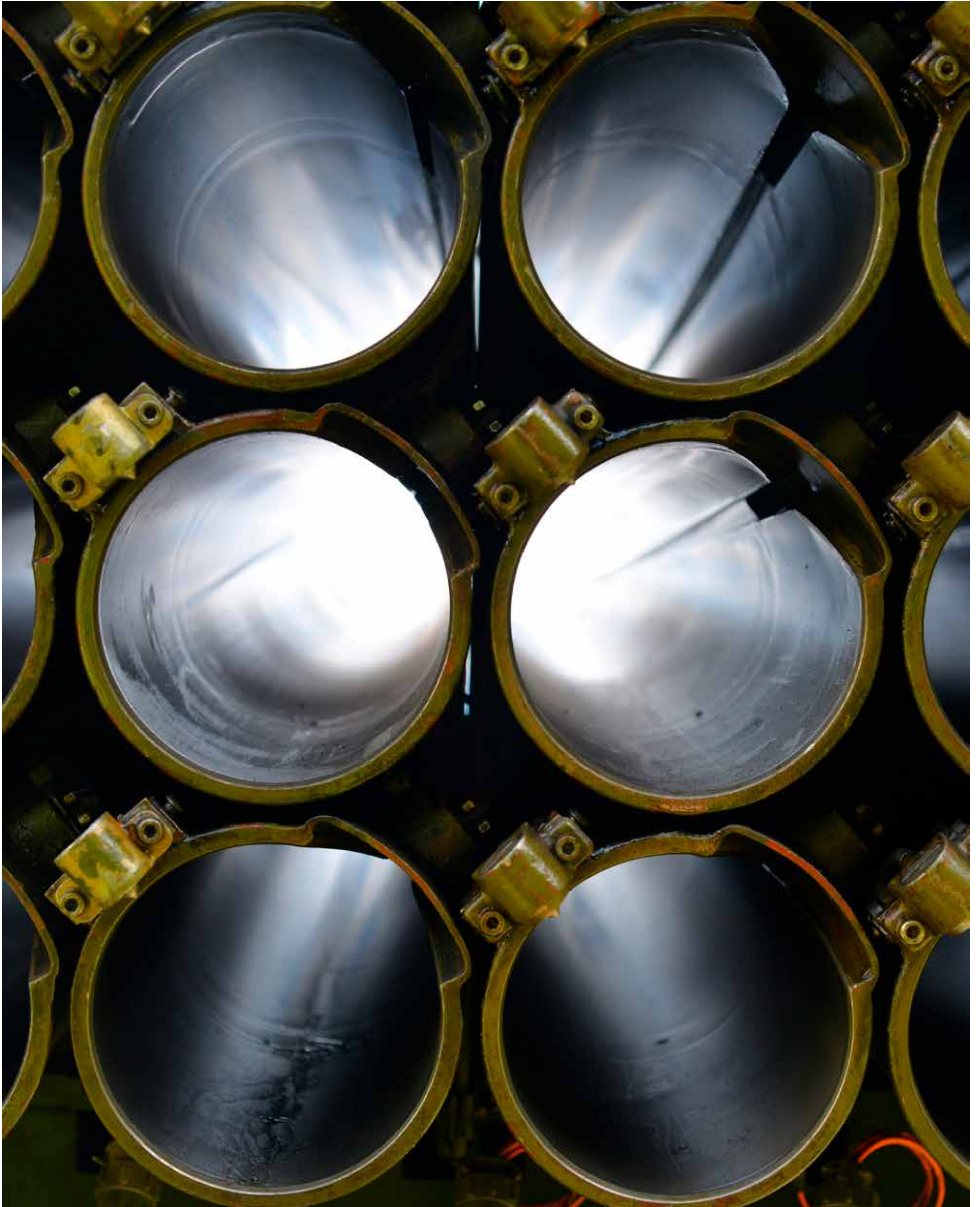
Porin prikaatin valapäivä 10.8.2023 Kokkolassa. 298 RSRAKH 06 -raskas raketinheitin