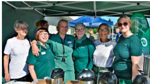
Kokkolan Sotilaskotiyhdistys oli asettanut valatapahtumaan kymmenkunta vihreää sisarta näyttelykentän kahdelle eri palvelupisteelle. Hymyllä ja sydämellä -asenne kantaa. Sotilaskotitoiminta on vapaaehtoista maanpuolustustyötä siinä missä reserviläisyhdistystenkin toiminta.