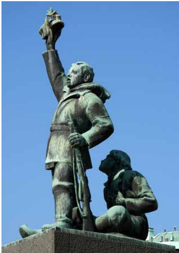
Kuva 8 Kahta suojeluskuntalaissotilasta esittävä pronssipatsas