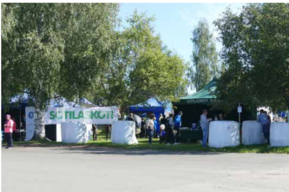
Vapaaehtoista maanpuolustustyötä tekevien järjestöjen ja yhdistysten yhteisosasto sijaitsi omalla viihtyisällä alueellaan Ollikkalan koulutilan puistomaisessa pihamaastossa.