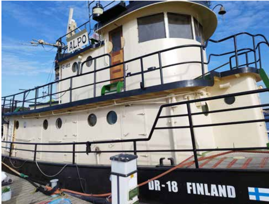
Alpo satamassa maalattuna.

Aluksen historiaa lyhyes- ti: M/S Alpo on ostettu Suomeen vuonna 1946. Alus on rakennettu City Is-