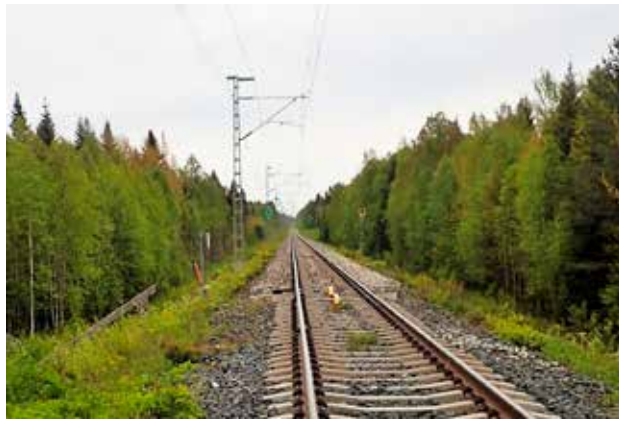
Maksniemessä jalkaväkijoukkue ja konekivääriryhmä, yhteensä 37 miestä, jäi yllätettynä saksalaisten vangiksi. Tästä paikasta rataa pitkin kaapatut suomalaiset kävelytettiin yöllä saksalaisten aseisiin ja sotavangeiksi.