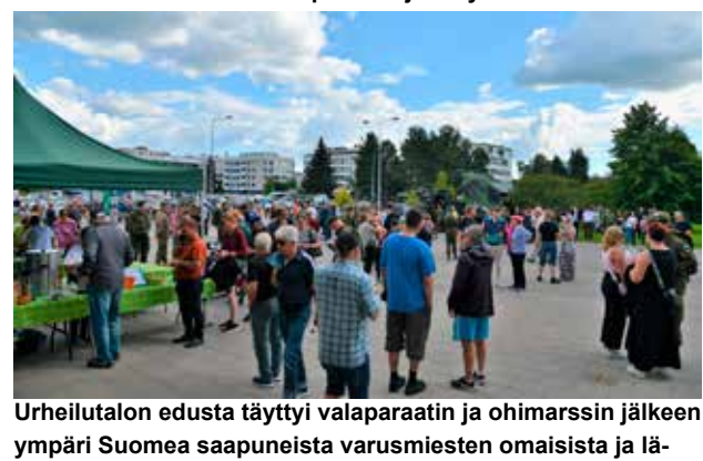
Urheilutalon edusta täyttyi valaparaatin ja ohimarssin jälkeen ympäri Suomea saapuneista varusmiesten omaisista ja läheisistä sekä vapaalla olleista kaupunkilaisista ja turisteista. Sotilaskodin munkkikahvit olivat yleisön mieleen.