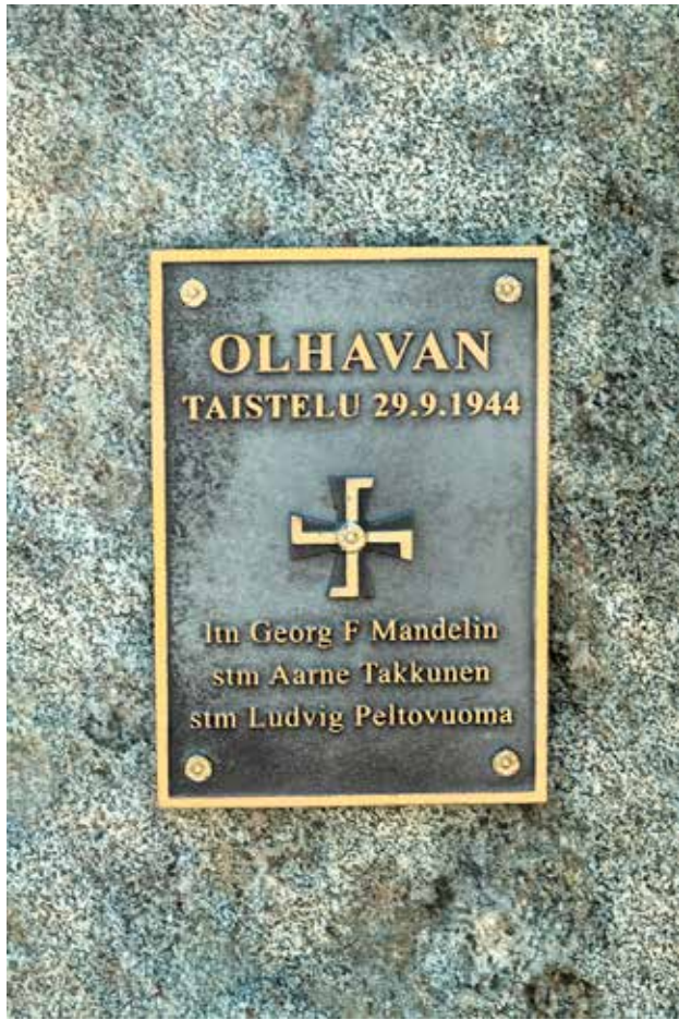
Olhavalaisen koulun pihapiirissä sijaitsee tämä muistomerkki, johon on ikuistettu ensimmäisten Lapin sodassa kaatuneiden suomalaisuhrien nimet.