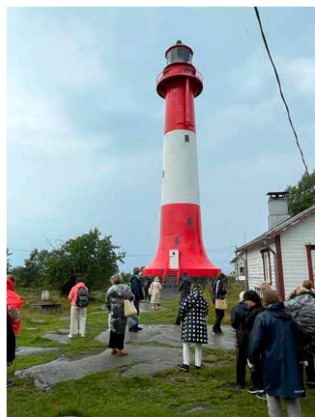
Saaren ainutlaatuisuus puhutti, eikä pieni sade haitannut kulkua.