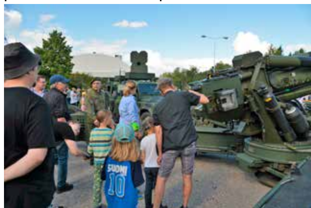
Jos paikalla ei ollut 155 K 98 -kanuunaa esitellyttä varusmiestä, saattoi tykistössä palvellut perheenisäkin esitellä latausmekanismeja jälkeläisilleen.