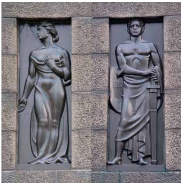
Kuva 5 Läntisen sivustan Laki- ja Uskonto-allegoriat