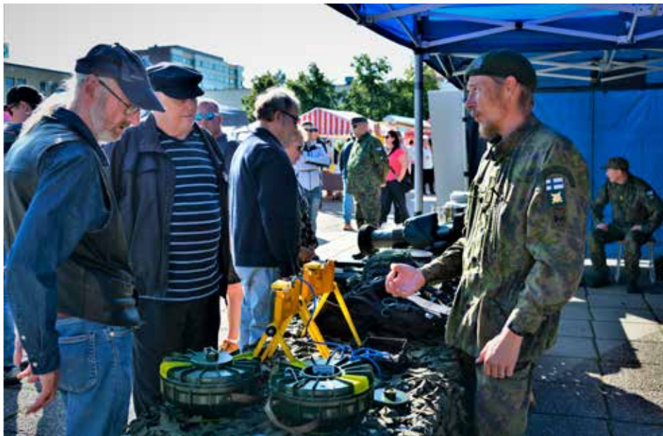
K-P Maanpuolustajien piirin osastolla käyneet saivat päteviä vastauksia muun muassa maakuntakomppanian harjoituksissa käyneiltä reserviläisiltä.

Keski-Pohjanmaan Maanpuolustajien piirin perinteinen venetsialaisinfo pidettiin jälleen Kokkolan kauppatorilla. Kaupunkilaisia ja maakunnan ihmisiä saapuu venetsialaisjuhla-lisuuksiin ja yleisötapahtumiin satamäärin, usein säästäkin piittaamatta. Tapahtumalla on aina nostalginen ja rento tunnelma, mitä nyt korosti vielä aurinkoisen lämmän sää. Oamalla osastollaan sekä reserviupseeri- että reserviläisyhdistysten aktiivit esittelivät kansalaisille toimintaansa, ja esille oli asetettu myös aseita ja harjoitusmateriaalia, joita käytetään kertausharjoituk-