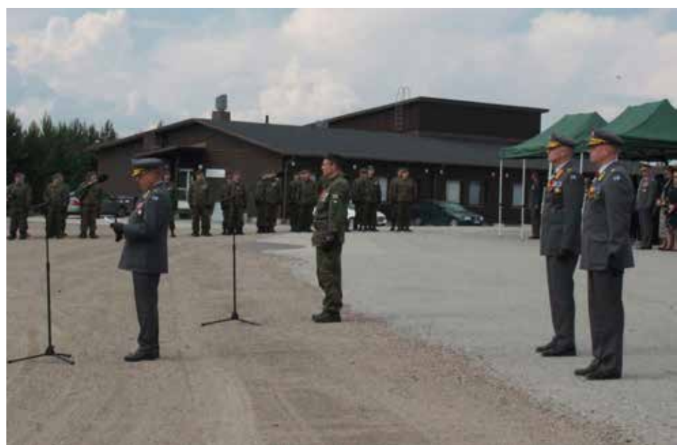
Uusi komentaja prikaatikenraali Ari Laaksonen (vas.), Maavoimien komentaja, kenraaliluutnantti Pasi Välimäki (2. oik.) ja entinen komentaja, prikaatikenraali Manu Tuominen (1. oik.).

muistioita tapansa mukaan. Paraatin jälkeen tilaisuus jatkui ruokalan tiloissa arvokkaassa tunnelmassa.