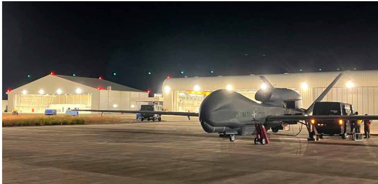
NATO AGS pre-flight preparations at Sigonella for the first flight of an RQ-4D Phoenix aircraft over Finland.

Puolustusvoimien mukaan lentoja tullaan suorittamaan Suomen ilmatilassa tulevaisuudessakin ja lentoja tullaan tekemään erityyppisillä ilma-aluksilla, niin miehittämättömillä kuin miehityksilläkin. Niiden yksityiskohtia ei operatioturvallisuussyistä voida kertoa. Ilmailun uutisportaali Len-