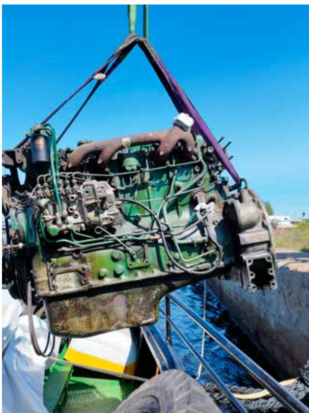
Vanha Volvo Penta poistettuna konehuoneesta.