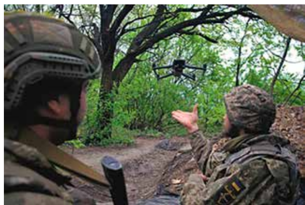
Ukrainalainen tiedusteluryhmän taistelija laittaa pienen droonin ilmaan Bahmutin kaupungin liepeillä 8 toukokuuta 2023.

Tiedusteluyhteisölle taas on tärkeää, että lähteet ja käytettävät metodit eivät paljastu. Ilman niitä salainen tiedonhankintakaan ei olisi mahdollista. Yhdysvaltain kansallisen tiedustelujohtajan Avril Hainesin mukaan perusteellista pohdintaa käytiin siitä, mitkä ovat ennakoivan julkistamisen riskit ja hyödyt. Nato-jäsenenä Suomikin pakonomainen käyttö on sittemmin tuottanut länessä lähinnä lukuisia meemejä. Sodasta puhuminen Venäjällä taas tuottaa vankeusrangaistuksen.