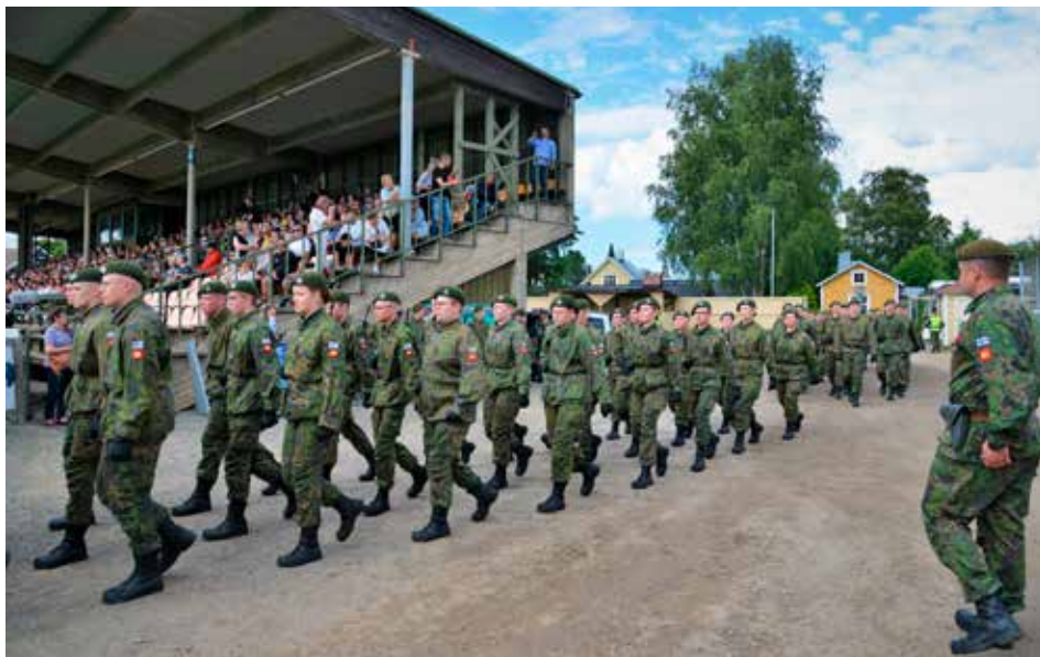
Alokkaat näyttivät marssitaitoaan saapuessaan Keskusurheilukentälle ja ryhmittymään paraatimuodostelmaan täysien katsomorakennelmien eteen.