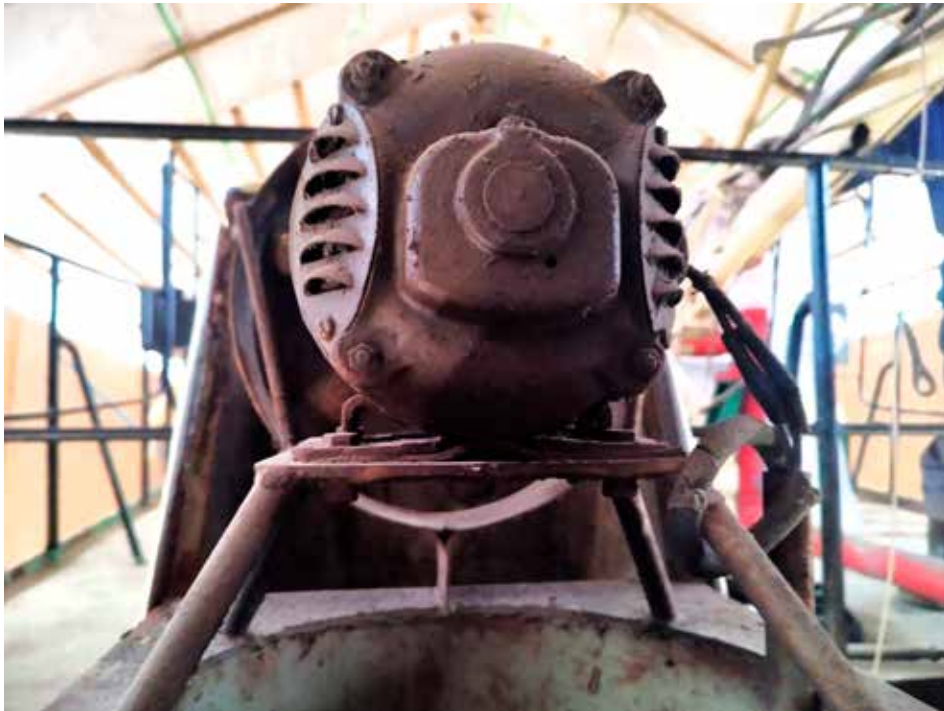
Alkuperäinen konehuoneen puhallin ennen kunnostusta.

Teksti ja kuvat: Ylikonemestari Jari Kerola