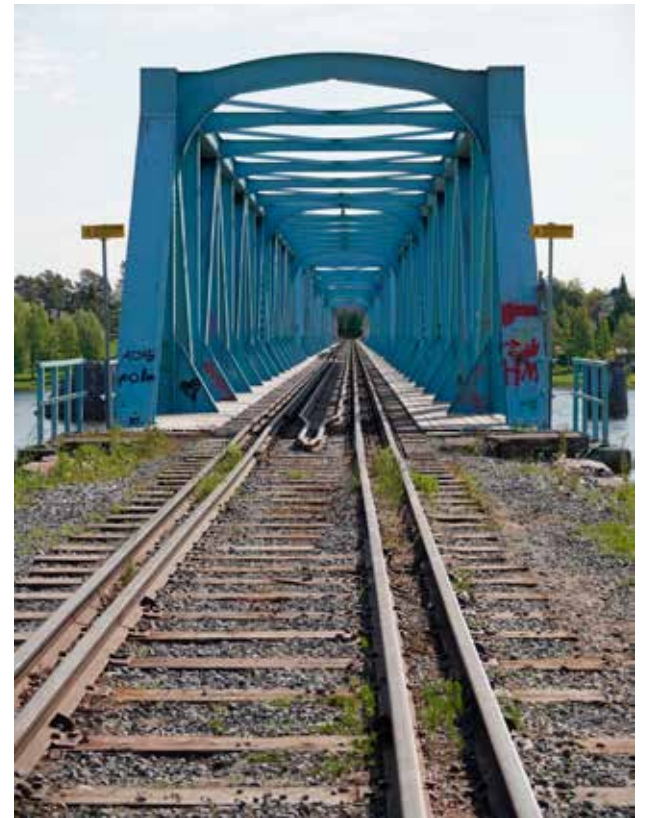
Suomen ja Ruotsin rautateiden raideväliit poikkeavat toisistaan, ja raja-alueen sillalla on tämä otettu huomioon oheisella ratkaisulla.

Kalixissa ja Perämeren rannikolla. Ne ovat jo vuosikymmeniä olleet vailla