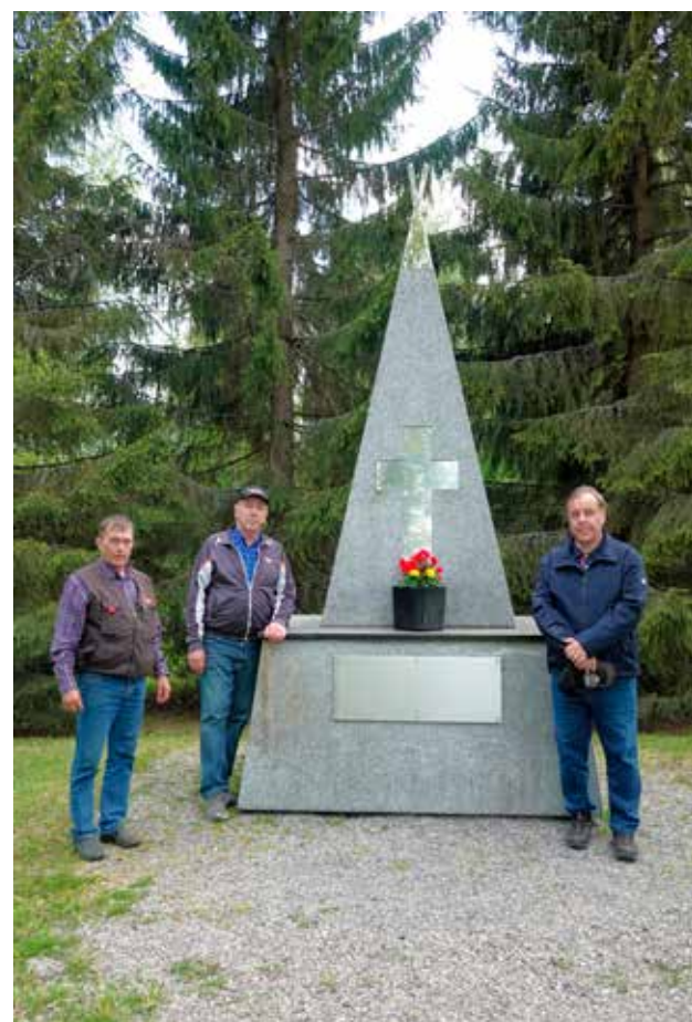
Kivirannan taistelun 6.-8.10.1944 muistomerkki. "RAUHAN JA ISÄNMAAN VAPAUDEN PUOLESTA VELJEYDEN HINNALLA" Teksti myös saksaksi: "UNSEREN TOTEN FINNISCHEN UND DEUTSCHEN SOLDATEN" Alla ovat molempien maiden taisteluun osallistuneiden joukko-osastojen lyhenteet.