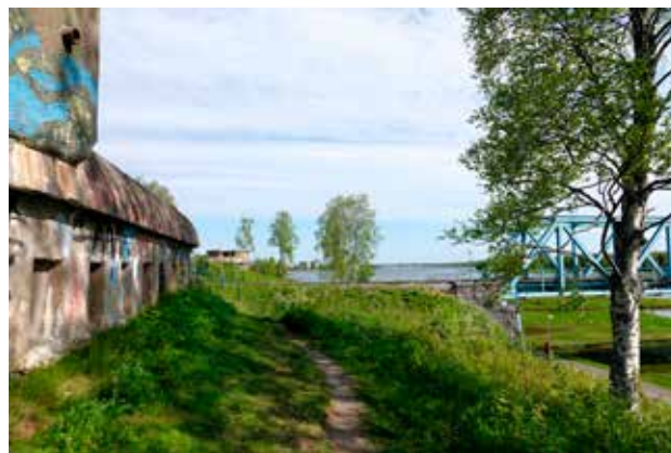
Tornionjoen länsirannalla molemmin puolin Suomeen vievää rautatietä sijaitsevien bunkkereiden ampuma-aukot ovat Suomen suuntaan, mistä venäläisten ajateltiin tulevan. Taustalla näkyy Tornionjoeta ja Haaparannan kaupunkia vasemmalla.