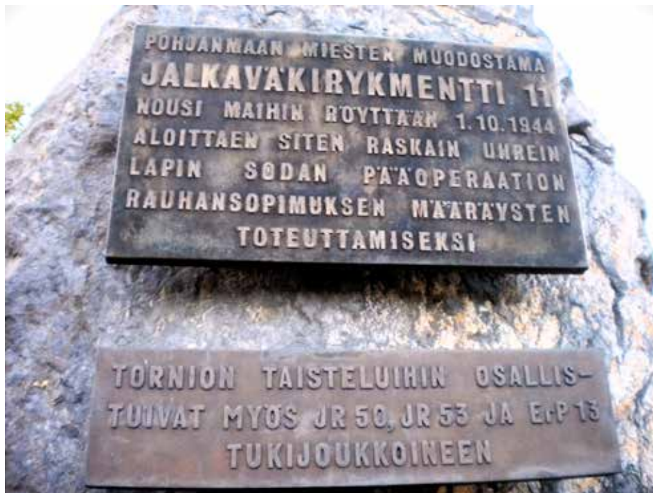
Pohjan prikaatin kiltä pystytti tämän maihinnousun muistomerkin Röytän satamaan v. 1973, samana vuonna, kun allekirjoittanut oli prikaatissa suorittamassa varusmiespalvelustaan. Allekirjoittaneen isä (III/JR 50) oli mukana maihinnousun neljännessä aallossa 2500 muun sotilaan kanssa.

Koska pohjoista kohti ajeltiin pitkin 4-tietä, niin Olhavan taistelun kulku ehdittiin käydä läpi hyvissä ajoin ennen Kemiä. Jatkosodan rauhanneuvotteluissa neuvostoliittolaiset velvoittivat suomalaiset ajamaan saksalaiset joukot pois maasta. Operaatio käynnistettiin, mutta kun saksalaisten takaa-ajo pohjoisen suuntaan ei sujunut valvontakomission mukaan riittävän nopeasti, suomalaiset joutuivat koventamaan otteitaan saksalaisia vastaan. Iin Olhavassa joukoille annettiin tehtäväksi vallata ehjänä Olhavajoen ylittävä rauta-