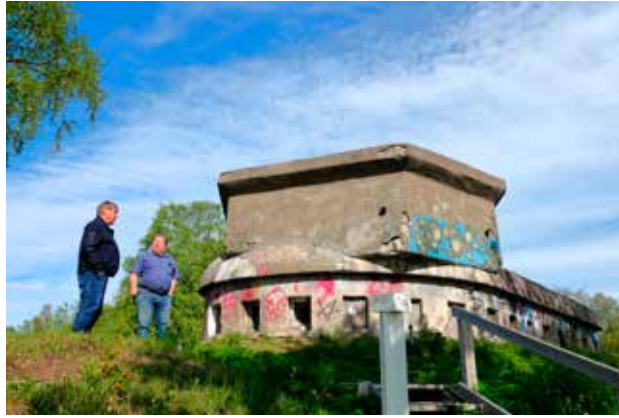
Tornevall-bunkkerit ovat jääne ajalta, jolloin ruotsalaiset varautuivat puolustautumaan Neuvostoliiton hyökkäystä vastaan. Osmo Halonen (vas.) yleis- ja Markku Myllylahti paikallisoppaana.