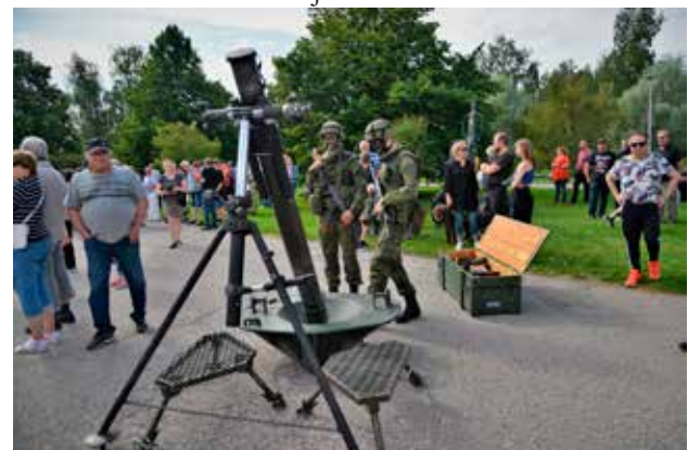
Raskas kranaatinheitin tulee valatilaisuuteen osallistuneille Satakunnan tykistörykmentin Kranaatinheitinkompanian varusmiehille tutummaksi palveluajan myötä.