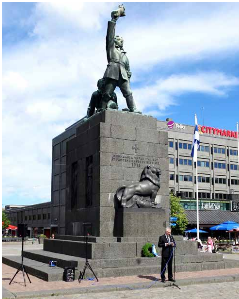
Kuva 3, Aimo Nyberg kertomassa Suomen Vapaudenpatsaan sisältämästä symboliikasta

Kts. Kuva 2. Seppelienlaskun jälkeen Pohjanmaan maakuntajohtaja Mats Brandt piti juhlapuheen 85 vuotta Vaasan torinäkömää hallinneelle muistomerkille. Brandt käsitteli puheessaan kenraali Mannerheimin aloitteeseen perustuvan patsashankkeen toteutusta sekä patsaan suurta valtakunnallista merkitystä itsenäistyneen Suomen vapauden symbolina. Patsaan edustamat arvot ja symbolit ovat juuri tällä hetkellä äärimmäisen ajankohtaiset. Ukrainan kansa osoittaa vastaavaa isänmaarakkautta ja itsemääräämisoikeuden kaipausta