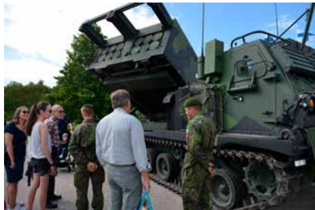
Jo ennen valatilaisuuden alkua Urheilutalon edustan kentälle oli tiensä löytänyt suuri joukko varusmiesten läheisiä ja kaupunkilaisia tutustumaan Porin prikaatin kalustoon.