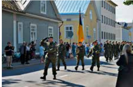
Runsaan väkijoukon kerännyt ohimarssi suoritettiin pitkin Kusta Adolfinkatua. Sääkin suosi, uhkaavat kuuropilvet väistivät kaupungin keskustan.