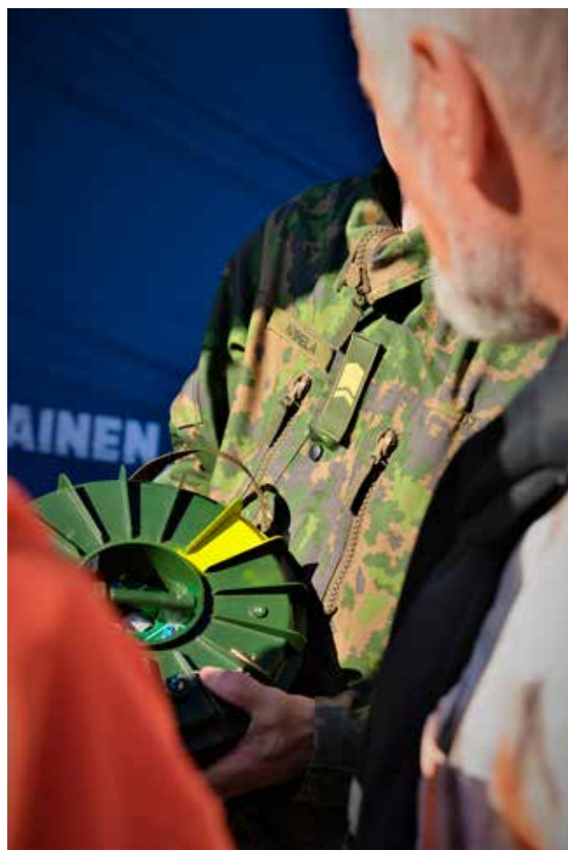
Panssarimiinat ovat pitkälti ohjelmoitavissa erilaisiin taistelutilanteisiin.