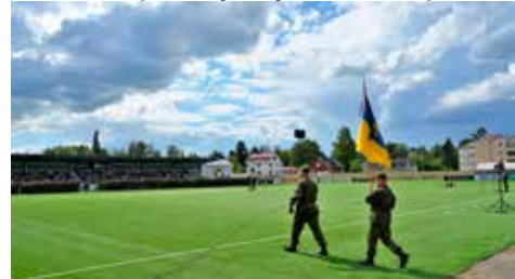
Porin prikaatin lippu saapuu paraatijoukkojen ja yleisön eteen.