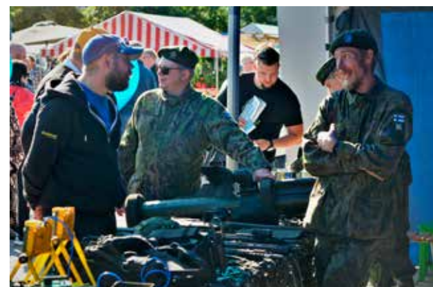
Reserviläiset esittelivät ajanmukaista harjoitusmateriaalia, mm. panssarimiinoja ja viuhkapanoksia.