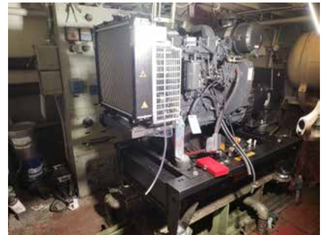
Uusi generaattori asennettuna konehuoneessa.